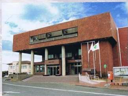
志摩市絵かきの町・大王美術ギャラリー外観