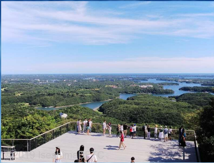
Yokoyama Observatory จุดชมวิวยุโทยามะ