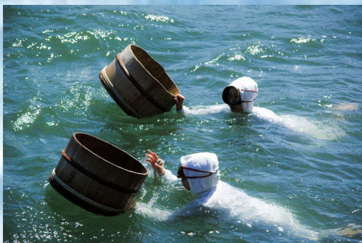
Mikimoto Pearl Island