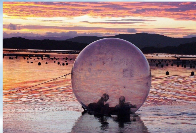
Shima Nature School โรงเรียนธรรมชาติชิมะ