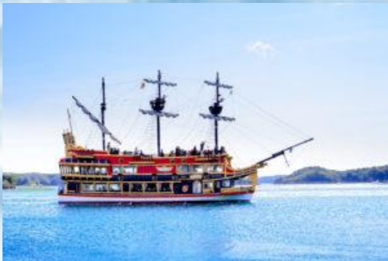
Kashikojima Espana Cruise ล่องเรือสเปนคาชิโกะจิมะ