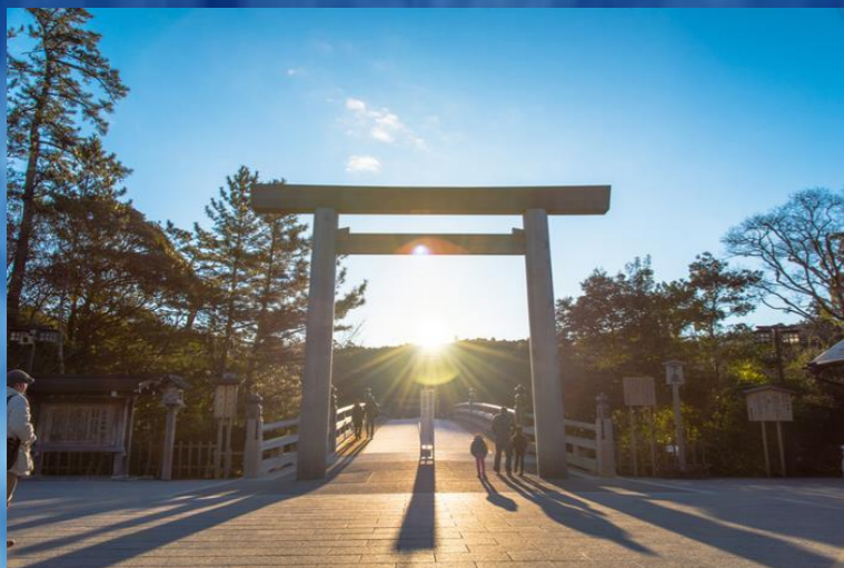
Ise Grand Shrine