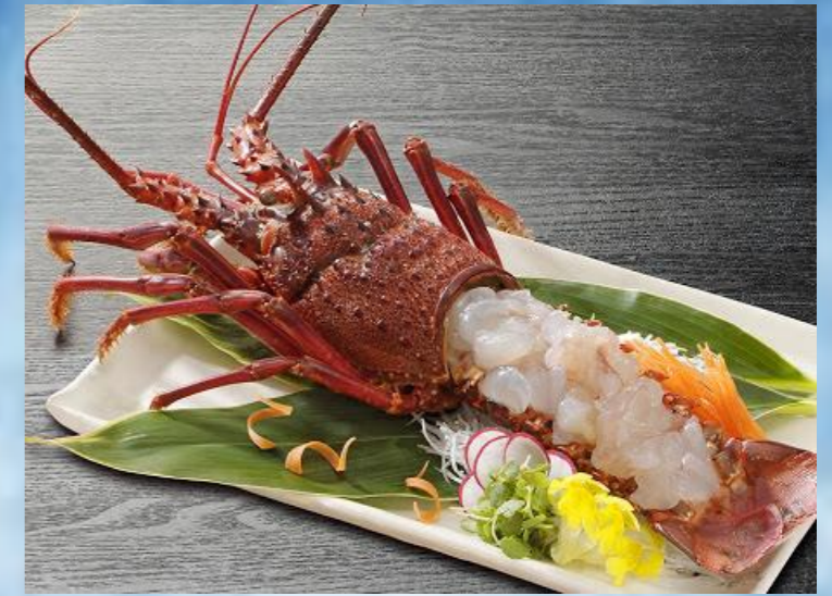
Japanese Spiny Lobster กุ้งมังกรฮิเสะเอบิ