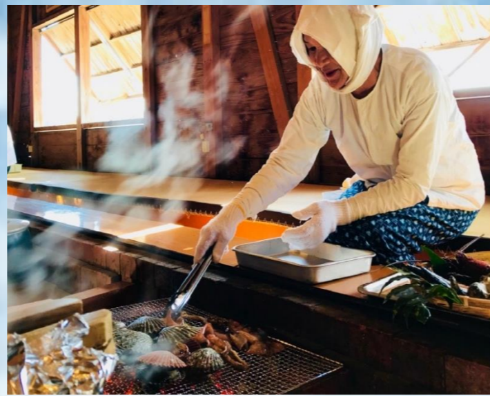
Ama Hut กระท่อมอามะซัง