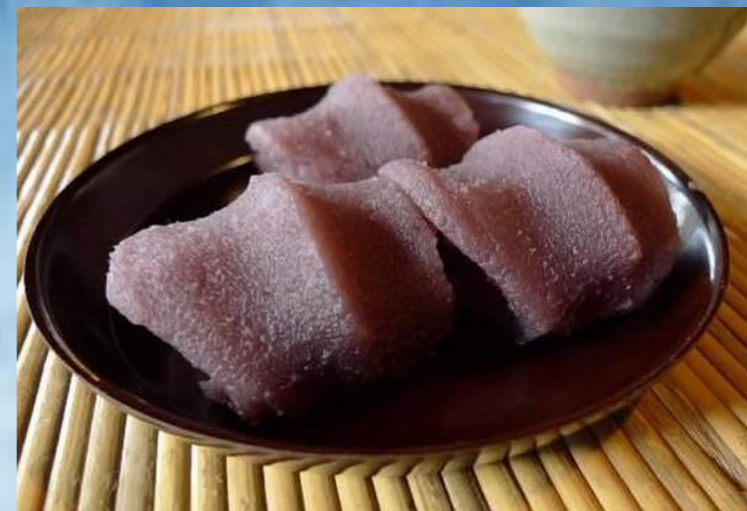
Aka Fuku Mochi