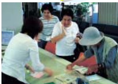
志摩支所でも終日多くの来客で、窓口は混雑しました