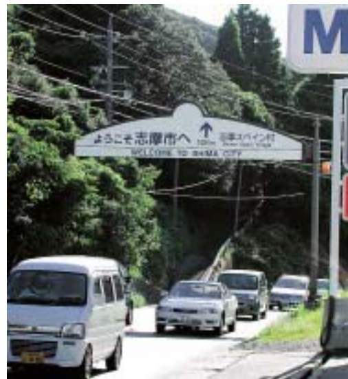
志摩市への玄関口である伊勢道路の案内看板。車でお越しになる多くの観光客をお迎えします