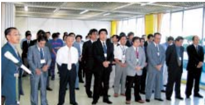
浜島支所での開所式。新しいメンバーで新しいまちづくりへの意気込みを新たにしました