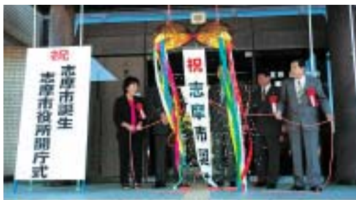
市役所の開庁式では、前5町議会議員がくす玉を割って、新市誕生に華を添えました