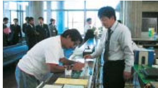
大王支所での印鑑登録証の交換の様子。新市発足により登録番号が新しくなります。まだの人は、お早めに・・・