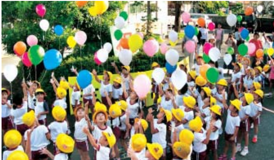
阿児支所の開所式には鶴方幼稚園児がお祝いに駆けつけ、風船を飛ばして新市誕生を祝いました。「志摩市よ、風船のように高く飛べ！」

さわやかな秋晴れの10月1日、志摩市がスタートしました。この日はまさしく歴史に残る「志摩市の誕生日」。各支所などの様子を写真でご紹介します。