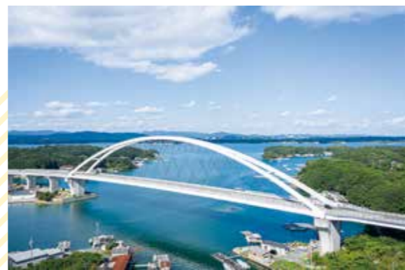
志摩大橋(パールブリッジ)

まち全体が伊勢志摩国立公園に 含まれている志摩市。 山と海の強いつながりのもと生まれる 数々の景観ははるか昔から多様な色に 彩られ、多くの人を魅了してきました。