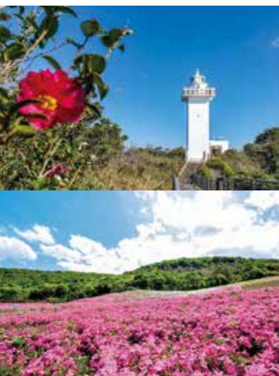
安乗埼灯台(上) 志摩市観光農園(芝桜)(下)

まち全体が伊勢志摩国立公園に 含まれている志摩市。 山と海の強いつながりのもと生まれる 数々の景観ははるか昔から多様な色に 彩られ、多くの人を魅了してきました。