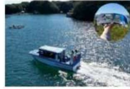
英虞湾周遊クルーズ・車窓カードイメージ