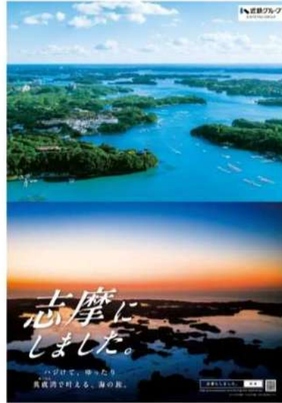
近鉄グループポスター

※各観光コンテンツは「EX旅先予約」で販売します。「EX旅先予約」の購入には「エクスプレス予約」・「スマートEX」への会員登録が必要です。予約方法や詳細は下記EX旅先予約特設サイトをご覧ください。