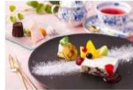
EXサービス会員向けカフェメニューイメージ