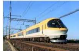
伊勢志摩ライナー イメージ