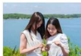
志摩スカイショット 撮影イメージ