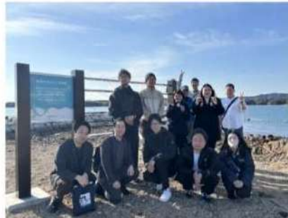
企画メンバーで集合写真

近鉄「賢島駅」徒歩約1分の賢島港から、定期船で約10分。アクセスの良さも魅力の間崎島は、現在約30人の島民が真珠養殖という伝統と暮らしを守り続けている小さな島です。潮の満ち引きという自然のリズムが生む、限られた時間にだけ現れる一瞬の“海の道”。人の営みと自然が寄り添うこの島で、日常を離れ、海と向き合いながら願いを託す特別な時間をお過ごしいただけます。本プランは、JR東海、近鉄グループホールディングスや志摩市、島民の皆様と連携し誕生した、〈今だからこそ体験してほしい〉唯一無二のプログラムです。