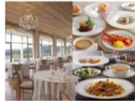
志摩観光ホテル 館内・ランチプランイメージ