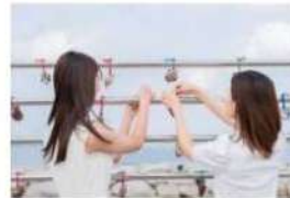
マーメイドロード・真珠の貝殻願掛け イメージ