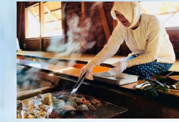
กระท่อมอะมะซัง