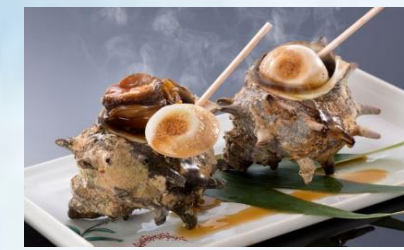
หอยตาวัว

โทบะมีทิวทัศน์หมู่เกาะเรียงรายทั้งดงาม มีอากาศอบอุ่น และยังเป็นเมืองที่ นายโคกิจิ มิกิโมโตะประสบความสำเร็จ ในการเพาะไข่มุกเลี้ยงแห่งแรกของโลก ในปี ค.ศ.1893