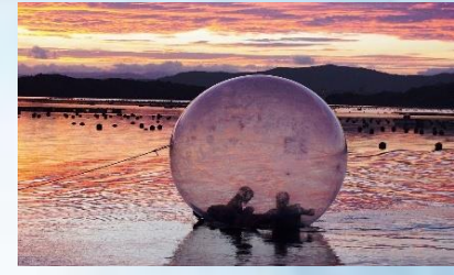
โรงเรียนธรรมชาติชิมะ