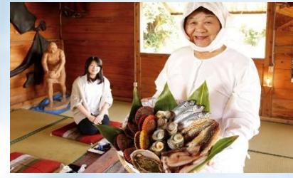
กระท่อมอะมะซัง