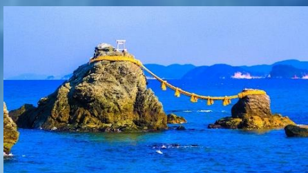
หินแม่โอะโตะฮิโอะ