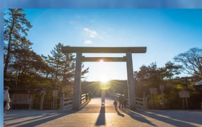
Ise Grand Shrine