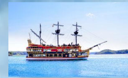
Kashikojima Espana Cruise