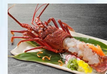
Japanese Spiny Lobster