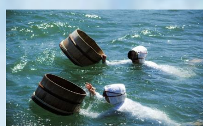
เกาะไข่มุกมิกิโมโตะ