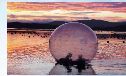
Shima Nature School