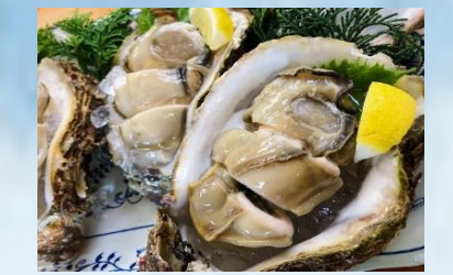
หอยนางรมโทบะ