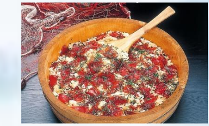
ข้าวซูชิทะเลโคเนะ

พื้นที่ทั้งหมดของเมืองชิมะอยู่ในเขต อุทยานแห่งชาติอิเสะชิมะที่สมบูรณ์ จึงมีอาหารทะเลหลากหลาย มีทิวทัศน์ ชายฝั่งทั้งดงาม มีป่าไม้อุดมสมบูรณ์ และมีอากาศอบอุ่นตลอดทั้งปี