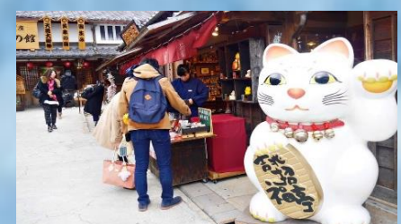
ถนนคนเดินโอะโตะฮิโอะ