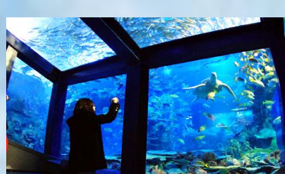
พิพิธภัณฑ์สัตว์น้ำโทบะ