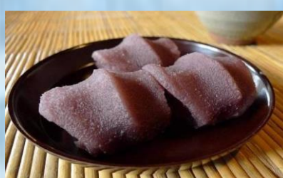
ขนมโมจิอะกะฟู