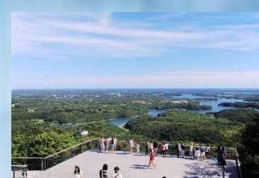
จุดชมวิวยุโกยามะ