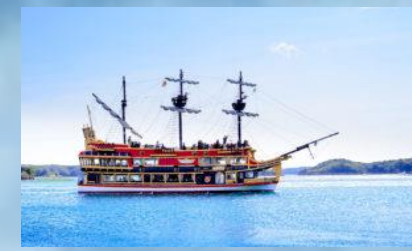
สองเรือสเปนคาชิโกะชิมะ