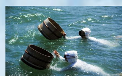
Mikimoto Pearl Island