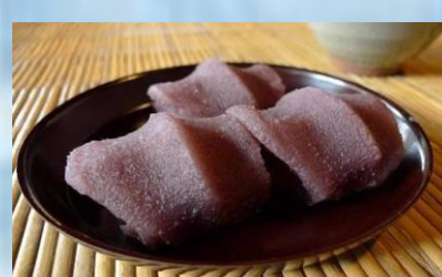
Aka Fuku Mochi