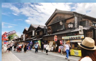
ถนนคนเดินโอะโตะฮิโอะ