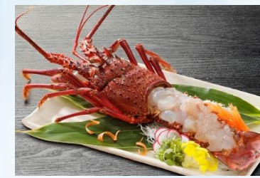
กุ้งมังกรอิเสะเอบิ