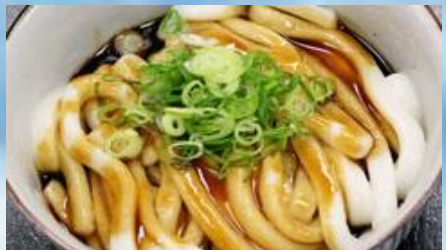
อิเสะอุด้ง

อิเสะมีอุณหภูมิโดยทั่วไปค่อนข้างอบอุ่น เป็นที่ตั้งของสถานที่ที่มีชื่อเสียง และแหล่งอารยธรรมสำคัญทางประวัติศาสตร์ และวัฒนธรรมมากมาย