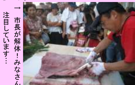
→ 市長が解体!みなさん注目しています…