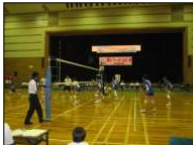
↑ シーガルズの紅白戦。プロ選手

午前に地元バレーボールチームとの交流試合の後、岡山シーガルズによる紅白戦が行われました。選手たちの迫力あるスパイクが決まり、難しいボールを見事にレシーブするたびに、会場からは大きな拍手が送られました。午後には市内の小中学生を対象にバレーボール教室が開かれ、子どもたちは熱心に指導を受けていました。