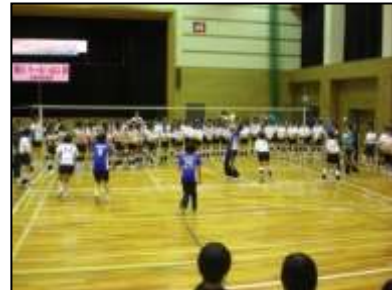
↑ バレーボール教室の様子