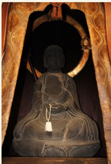
毎年2月24日には汗かき地蔵祭が行われています。

大王町波切に祀られている、汗をかく不思議な地蔵様です。地蔵様のかく汗の色で吉兆を予言し、吉祥の際は白い汗をかき、災難がある時は民衆に代わって苦しみ黒い汗をかくといわれています。