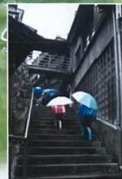
⑨ 古市町麻吉旅館 (写真)