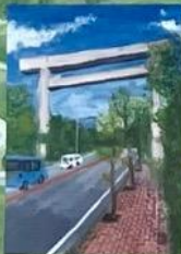
⑪ 御幸道路 (絵)