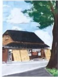
⑭ へんばや本店 (絵)