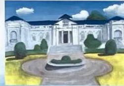
② 萱古館 (絵)