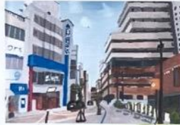
① 伊勢市駅前 (絵)