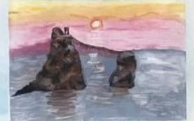
⑤ 夫婦岩 (絵)