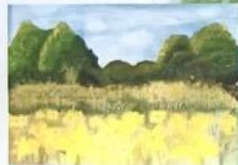
⑫ 上野町赤井山 (絵)