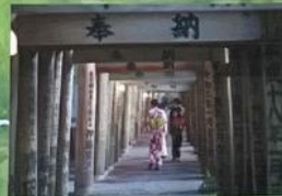
⑩ 豊川菖蒲荷神社 (写真)