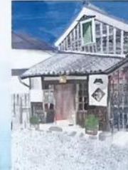
④ 河崎川の駅 (絵)