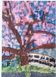
⑬ 宮川駅 (絵)