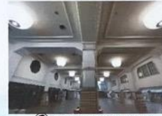
③ 宇治山田駅 (写真)