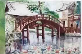
⑦ 金剛護国寺 (絵)