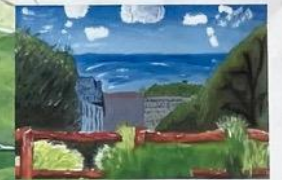
⑥ 音無山 (絵)