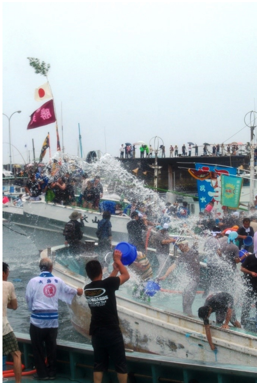
⑰潮かけ祭り（大島祭り）