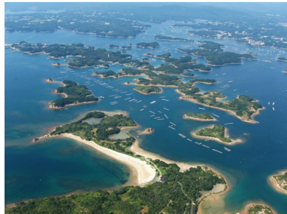
㉗リアス海岸と真珠養殖の筏の景観