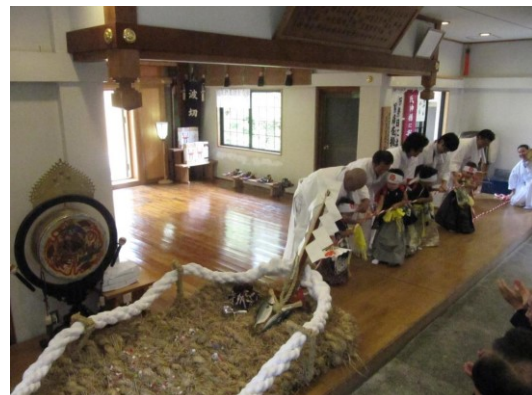
㉖波切のわらじ曳き