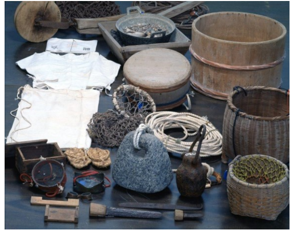
④伊勢湾・志摩半島・熊野灘の漁撈用具