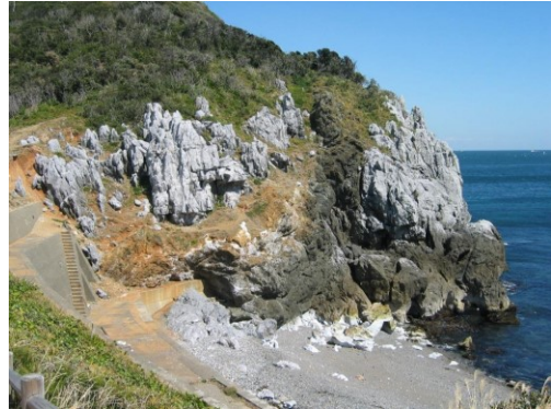
ニワの浜（カルスト地形）