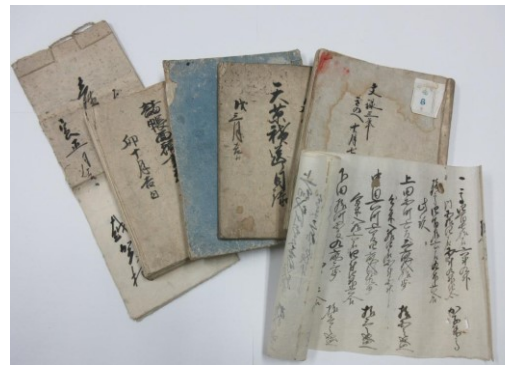
㉓ 旧越賀村郷蔵文書