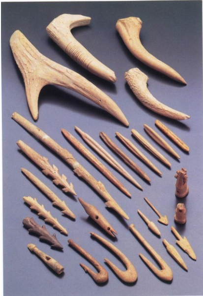
②白浜遺跡出土遺物