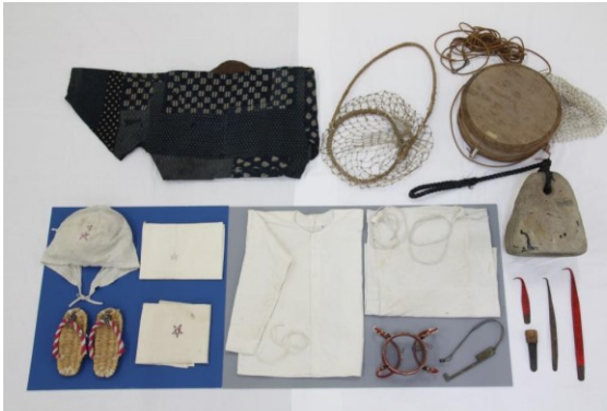
⑮志摩半島の生産用具及び関連資料