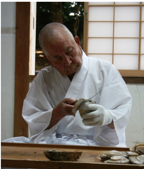
③国崎の熨斗鮑づくり