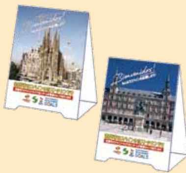
●卓上 POP（W90mm×H115mm） 表面、裏面で写真が異なります。