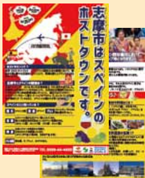
●チラシ（A4 サイズ：両面印刷）