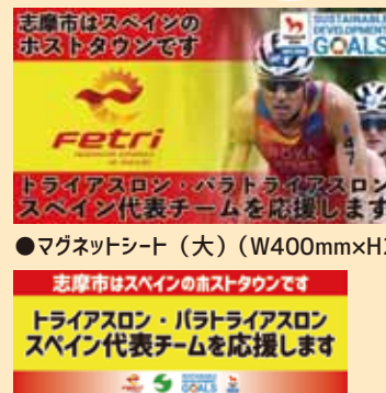
●マグネットシート（小）（W297mm×H110mm）