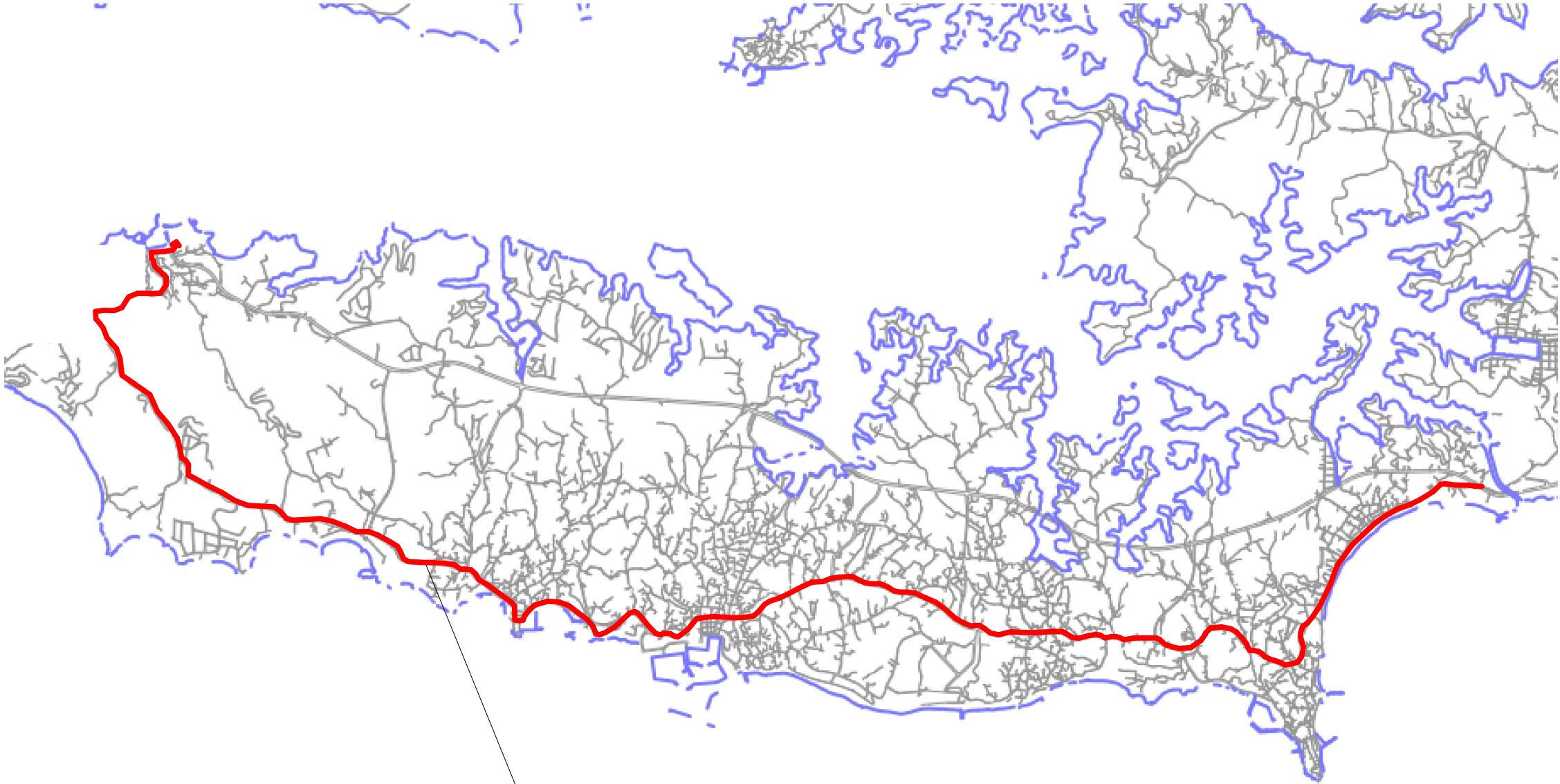
平面図S=1 : 40000