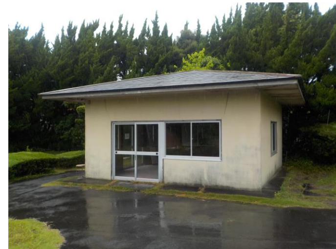
▽ 解体 休憩舎