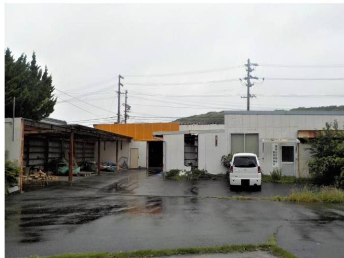
▽ 解体 白浜園地管理事務所