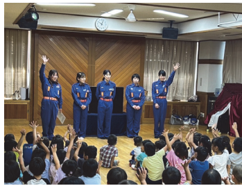
他市で行われている女性消防団の防災教室

答 消防本部消防長 市消防団の女性団員は現在11人で、平時の防火啓発から災害時の後方支援まで幅広く活躍しています。