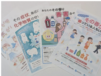
香害啓発ポスター類

答 健康福祉部長 阿児健康福祉センターにある健康推進課に連絡ください。関連部署と連携し対応します。