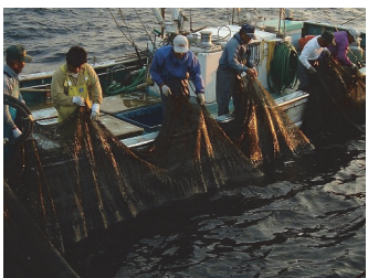
網を引く手、つなぐ未来

新規で漁業協同組合の組合員になった人や、既に組合員になった人が新たな職種を始めるときにも支援をします。