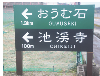
正しく修正された看板

問 誤った情報はすべて修正すべきと思いますが、おうむ石と記載した冊子やパンフレット等はど