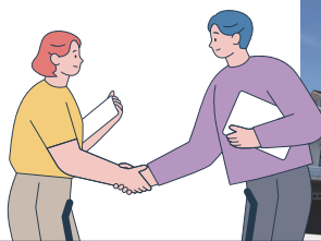
物価高から医療を守る

答 給付対象を高校等50人、大学等61人と見込んでいましたが、実績が高校等31人、大学等20人ととどまったため、不用額が生じました。