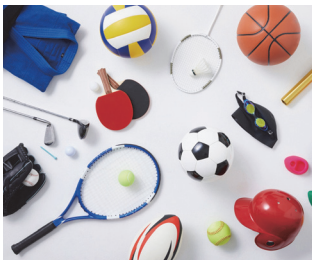
好きなスポーツができるまち