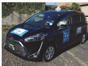
「いつもの外出」をもっと自由に

答 乗降実績データの分析や、利用者アンケートを定期的を実施し、利用実態等の把握に努めます。 このような分析を通じて、地域のニーズ等を的確に把握し、運行体制や停留所の配置等、柔軟な見直しを図ることで利便性の向上を推進し、より利用しやすい公共交通の構築を目指したいと考えています。