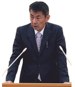
おがわ てるあき 小河 光昭 議員

一方、団員減少に伴う確保策が急務となっており、令和8年2月の本部会議では、特定の役割を担う「機能別団員・分団」の設置の協議を消防団長および各方面隊長へ要請しました。 今後は、女性がより参加しやすい「女性消防団」等の設置も視野に入れ、消防団本部と連携して体制整備を進めていきたいと考えています。