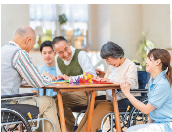
住み慣れた地域でイキイキと

問 サンライフあごや広域行政組合の通所介護事業の停止により、デイサービスの供給が狭まっています。実態調査と他自治体の支援事例を調査しませんか。