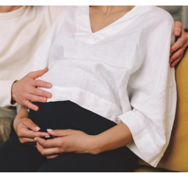
安心できる出産体制へ

答 産科医療機関がない地域の支援として、健診から産後までを支える県で初の取り組みで、出産後に一括して申請を受け付けて、精査後に入金します。