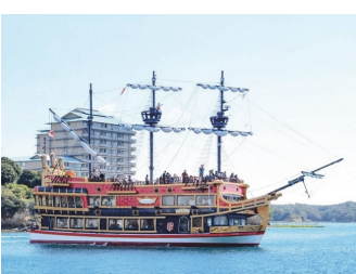
新たな夜の魅力に

答 ナイトクルーズを夜の観光コンテンツとして確立させ、日帰り客の宿泊転換や滞在満足度の向上を目指します。夜の魅力的な過ごし方を提示することで、消費拡大等を図り、持続的な誘客につなげたいと考えています。