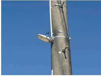
暗がりゼロへLED化進む

また、IoT※技術を活用したスマート防犯灯は効率化に有効ですが、通信環境やコスト等の費用対効果を慎重に見極める必