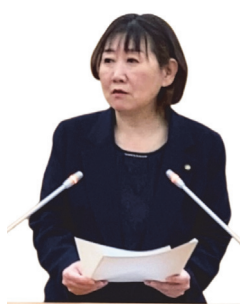
わたなべ ゆりか 議員 渡辺 友里夏