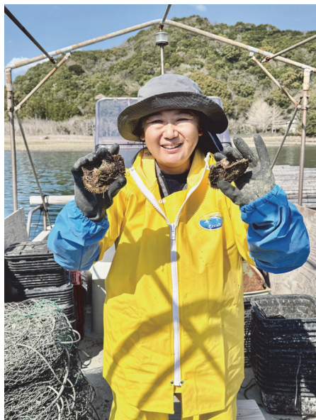
海と生きる地域おこしの新しい光

答 市長 隊員を温かく迎え入れる「市民力」と隊員の「志摩への愛着」が相まって、80%を超える高い定着率を実現しています。今後は、サーフィンや食といった本市固有の魅力を、市民の皆さんと協力しながら隊員のノウハウを生かして世界へ発信します。