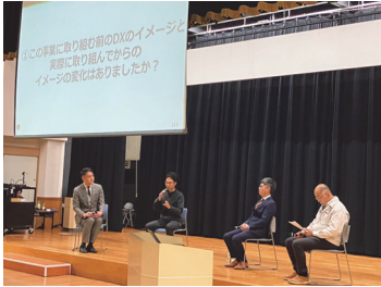
市内事業者のDX導入成果発表会

今後①事業者の魅力向上・事業拡大②人材育成③就職促進の3本柱で事業を展開し、魅力ある雇用と人材確保を確実に進めていきます。市は行政施策とのパッケージ化を図り、事業間の相乗効果を生み出す