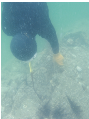
海女さんによるガンガゼ駆除

この海水温の変化を水産業再生への確かな機会と捉え、今後も現場からの声や水産研究所からの情報を得ながら、漁業関係者と連携し、持続可能な漁業の確立に向け、環境や状況に応じた様々な取り組みを推進していきたいと考えています。