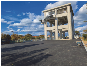
令和8年1月に完成した甲賀北津波避難タワー

答 危機管理統括監 自衛隊等での職務経験を持つ「防災技術指導員」が各地区へ出向き、非常持ち出し品の準備等、自助の重要性を粘り強く啓発し、地域防災力の向上を図っています。