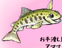
お手渡し魚 アマガイ