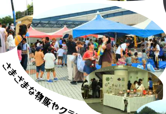
さまざまな物販やクラフト＆マルシェ