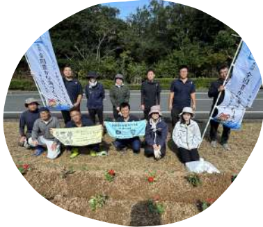
職員による花植え