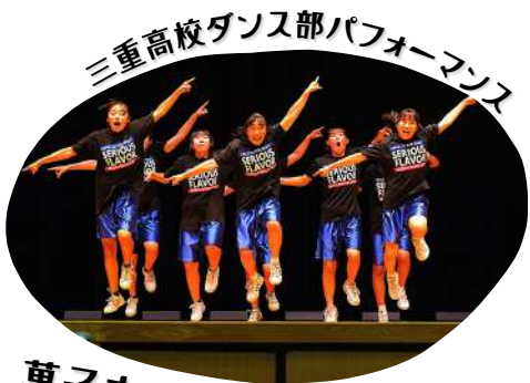
菓子まきで盛り上がり最高潮！

志摩市商工会、三重県建設業協会志摩支部、志摩ロータリークラブ、志摩ライオンズクラブを中心に、大会にむけて市民会議が一丸となり、志摩市の未来を担う子どもたちの笑顔のために、最高に楽しいイベントを開催！