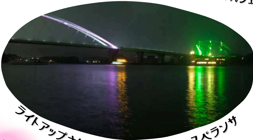
ライトアップされたパールブリッジとエスペランサ