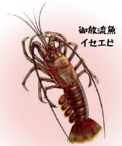
御飯流魚 伊セエビ