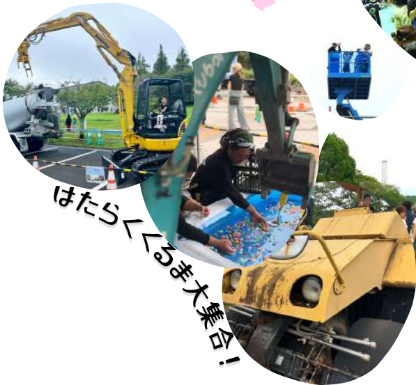
はたらくくるま大集会！