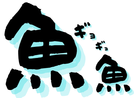
海ほおずき磯体験