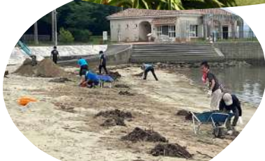
わたかのパールビーチ