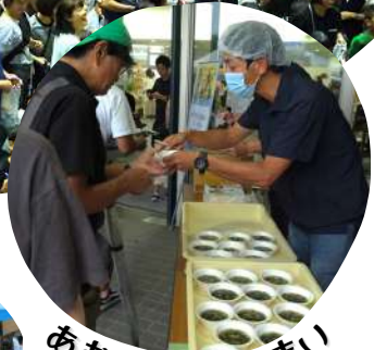
あおさ汁のふるまい